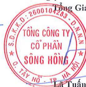
Lã Tuấn Hưng